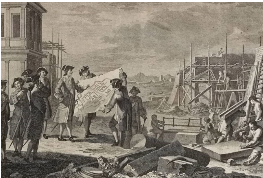
Пьетро Новелли «Основание Санкт-Петербурга»

Город Петра был задуман его основателем как «окно в Европу», однако Россия уже в то время была державой евразийской — русские первопроходцы продолжали движение «встречь солнцу», на восток. Именно поэтому Петербург как социальное, культурное и экономическое явление с самого начала объединил совершенно разные народы: будущую столицу русский царь Петр I изначально видел многонациональной.