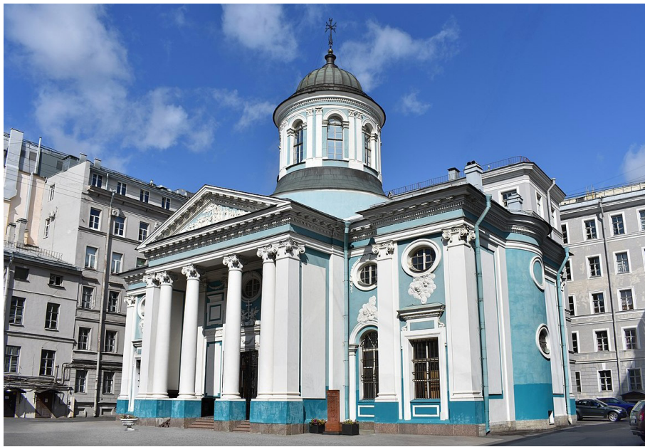
Армянская церковь, освящена в 1772 году

Итальянская община в Петербурге никогда не превышала полутора тысяч человек. Но ее представители внесли в развитие Петербурга огромный, неоценимый вклад. Занимали ведущие позиции в архи-