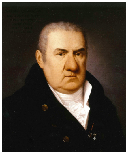
Джакомо Кваренги (1744–1817) — итальянский архитектор

тектурной, художественной и театральной жизни столицы. Выходцами из собственно Италии были Джакомо Кваренги, Карло Росси, Антонио Порто. Из итальянской