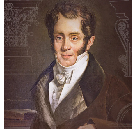
Карл Иванович Росси (при рождении — Карло ди Джованни Росси) — русский архитектор итальянского происхождения, автор многих зданий и архитектурных ансамблей в Санкт-Петербурге и его окрестностях.

Швейцарии на берега Невы прибыли Доменико Трезини, Луиджи Руска.