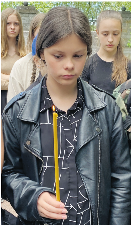
22 июня в Усть-Ижоре прошли мероприятия, посвященные Дню памяти и скорби.

81 год назад, в этот день 1941 года в 4 утра гитлеровские войска без предупреждения напали на нашу страну. Тихое утро разделило жизнь миллионов людей на до и после.